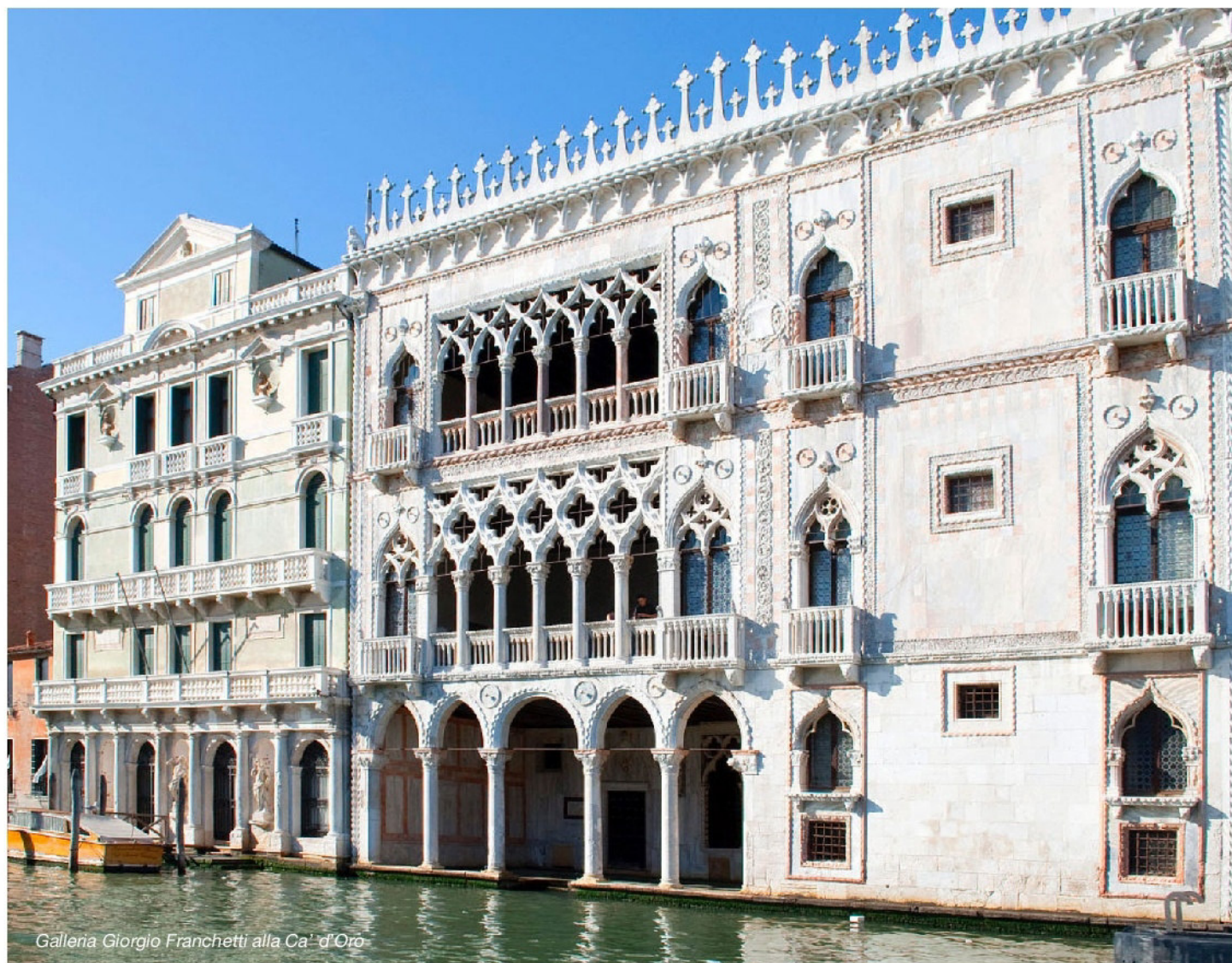
Galleria Giorgio Franchetti alla Ca' d'Oro