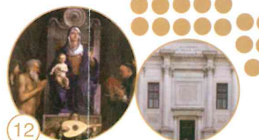
12 Madonna in trono con il Bambino e i Santi Francesco, Giovanni Battista, Giobbe, Domenico, Sebastiano, Ludovico da Tolosa (pala di San Giobbe)

Gallerie dell'Accademia Campo della Carità, Dorsoduro 1050 Apertura: lunedì dalle 8.15 alle 14.00; da martedì a domenica dalle 8.15 alle 19.30