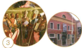
3 Madonna in gloria e otto Santi

Museo Diocesano Chiostro di Sant'Apollonia, Castello 4312 Apertura: da martedì a domenica: dalle ore 10.00 alle ore 18.00 (ultimo ingresso 17.30) Ingresso Museo: € 6,00; ridotti: € 3,00 Per gli itinerari guidati, prenotazioni e altre informazioni www.venezianbc.org