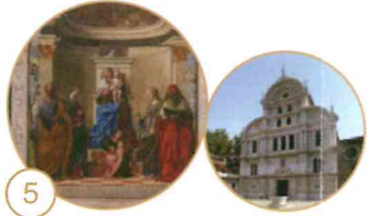
5 Madonna con il Bambino e i Santi Pietro, Caterina d'Alessandria, Orsola e Gerolamo e un angelo musicante

Chiesa di San Zaccaria Campo San Zaccaria, Castello 4693 Apertura: nei giorni feriali dalle 10.00 alle 12.00 e dalle 16.00 alle 18.00; domenica e solennità dalle 16.00 alle 18.00