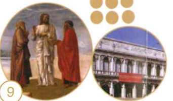
9 Trasfigurazione di Cristo sul monte Tabor

Museo Correr Piazza San Marco, San Marco 52 Apertura: dal 1 novembre al 25 marzo tutti i giorni dalle 10.00 alle 17.00; dal 26 marzo al 31 ottobre tutti i giorni dalle 10.00 alle 19.00