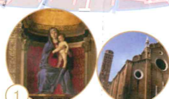
1 Madonna con il Bambino e i Santi Pietro, Nicola da Bari, Benedetto e Marco e angeli musicanti.

Basilica di Santa Maria Gloriosa dei Frari San Polo 3072 Apertura: nei giorni feriali orario continuato dalle 9.00 alle 18.00; domenica e solennità dalle 13.00 alle 18.00