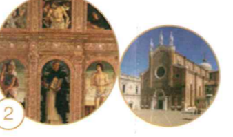
2 Pala con i Santi Cristoforo, Vincenzo Ferrer e Sebastiano (politico di San Vincenzo Ferrer)

Basilica dei Santi Giovanni e Paolo Campo dei Santi Giovanni e Paolo, Castello 6363 Apertura: nei giorni feriali dalle 9.00 alle 18.00; domenica e solennità dalle 12.00 alle 18.00