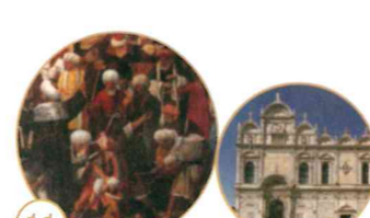
11 Ricostruzione fotografica del Martirio di San Marco

Scuola Grande di San Marco Campo Santi Giovanni e Paolo Apertura: da lunedì a domenica dalle 9.30 alle 17.30