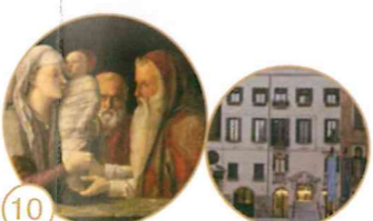
10 Presentazione di Gesù al Tempio

Fondazione Querini Stampalia onlus Campo Santa Maria Formosa, Castello 5252 Apertura: da martedì a domenica dalle 10.00 alle 18.00; lunedì chiuso