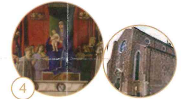
4 Madonna col Bambino, San Marco, Sant'Agostino, il Doge Agostino Barbarigo e angeli musicanti

Chiesa di San Pietro Martire di Murano Campello Michieli, 3 Apertura: da lunedì a venerdì dalle 9.00 alle 17.30 sabato, domenica e festivi dalle 12.00 alle 17.30