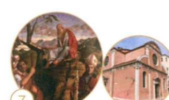
7 Pala con i Santi Girolamo, Cristoforo e Ludovico da Tolosa

Chiesa di San Giovanni Crisostomo Salizada San Giovanni Crisostomo, Cannaregio 5889 Apertura: da lunedì a sabato dalle 7.30 alle 11.30 e dalle 15.30 alle 19.30; domenica e solennità dalle 15.30 alle 19.30